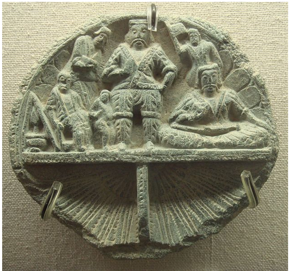
پادشاه یوشی و همکارانش، لوحه سنگی گندهارا، قرن اول ع

کوشان ها عقب نشینی کرده و به امپراطورچینی در دوره سلطنت هان (۸۹ - ۱۰۶) باج پرداختند. حدود ۱۲۰ ع، لشکر کوشان، یک شاهزاده ی که بعنوان گروگان به آنها فرستاده شده بود و مورد پذیرش امپراطور کوشان قرار گرفته بود، برای تخت کاشغرتعین کردند و بدین گونه نفوذ و نیروی شان در تاریخ باسین توسعه یافته و رسم الخط برهمی Brahi، زبان پراکریت Prakrit هندی برای اداره و هنر یونان بودائی بکار برده شد که در سریندیان انکشاف یافته بود. استفاده از این توسعه ساحه وی، یوشی کوشان ها اولین کسانی بودند که بودیزم را در شمال و شمال شرق آسیا، بوسیله فعالیت های ماموریتی مستقیم و ترجمه نوشته های بودیزم به چینی، مرسوم کردند.